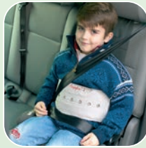
Art.-Nr. 6216/v, 6230/v