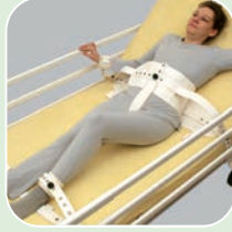
Art.-Nr. 2221, 2204, 2205