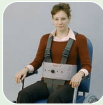
Art.-Nr. 6216/v, 6220, 6230/v