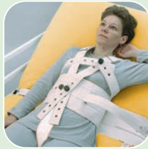
Art.-Nr. 2203, 2221