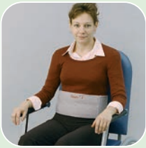
Art.-Nr. 6210/v, 6230/v