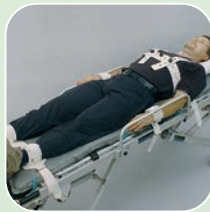
Art.-Nr. 5243, 2224/v, 5245/v