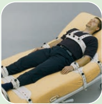
Art.-Nr. 4213/r, 4214/r, 4215/r